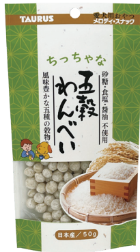
ちっちゃな 五穀わんべい うるち玄米、胚芽押麦(大麦)、 もちあわ、アマランサス、白ごま

希望小売価格(税抜き) 容量 入数 OPEN価格 50g | 24ヶ サイズ/重量 E 110×50×200mm/ 60g C 346×311×165mm/ 1,500g 4 512063 101083