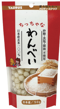
ちっちゃな わんべい 国産玄米100%

希望小売価格(税抜き) 容量 入数 OPEN価格 50g | 24ヶ サイズ/重量 E 110×50×200mm/ 60g C 346×311×165mm/ 1,500g 4 512063 101076