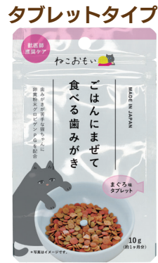
タブレットタイプ ご飯にまぜて食べる 歯みがきタブレット 鰹粉、脱脂粉乳、ショ糖、オリ ゴ糖、卵黄粉末(グロビゲンPG)、 マグロ粉末、ポリグルタミン酸、 フェカリス菌

希望小売価格(税抜き) 容量 入数 OPEN価格 10g | 50ヶ サイズ/重量 E 90×25×147mm/ 13g C 155×295×165mm/ 800g 4 512063 153020