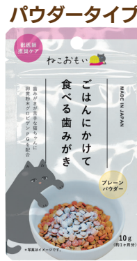
パウダータイプ ご飯にかけて食べる 歯みがきパウダー 鰹粉、脱脂粉乳、ショ糖、オリ ゴ糖、卵黄粉末(グロビゲンPG)、 ポリグルタミン酸、フェカリス菌

希望小売価格(税抜き) 容量 入数 OPEN価格 10g | 50ヶ サイズ/重量 E 90×25×147mm/ 13g C 155×295×165mm/ 800g 4 512063 153013